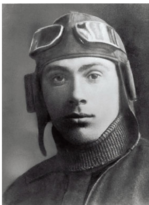
Капитан Н. Гастелло