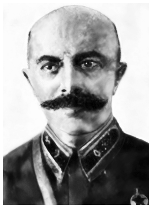
Генерал-майор Г. Шульц