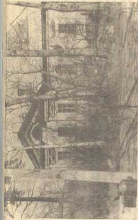
Немецкая школа. Парвовинская ул. - Д. С. Чиние сохранилась

«Напротив... была большая да- ча, населенная многочисленным не- мецким семейством. В этот час утра, пока все еще спали, родоначаль- ница немецкого племени, очень по- чтенная и красивая старуха, выхо- дила на улицу и садилась на ска- мью. Она делала это методично, и ки, с немецкой аккуратностью, и прежде чем осталась неподвижной, как статуя, наблюдая закипявшую дачную жизнь». В романе упоми- нается и парголовский ресторан «Ро- зар», где посетителей развлекал хор арфисток под управлением К. Гам-