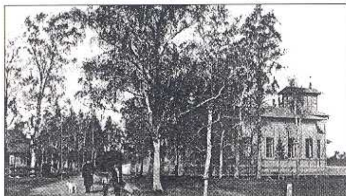
Рис. 2. Храм во имя Святых Апостолов Петра и Павла для новопоселенных колонистов по Высочайшему Государя Императора Александра I повелению сооружен в 1813 году на счет казны