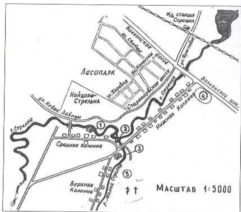
Схема расположения основных объектов Стрельнинского немецкого поселения.

Условные обозначения: 1. Немецкая начальная школа; 2. Кирха; 3. «Вифезда»; 4. Циклодром; 5. Кладбище