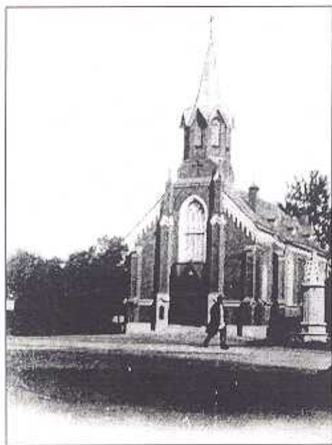
Петергофская лютеранская церковь. Архитектор Э. Ганн. Построена в 1864 г. Разрушена в 1934 г. Снимок 1909 г.