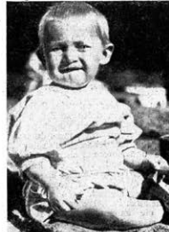
Kind dieser junge deutsche Spielzeug vom Kolchos 1. Mai wird einst in Geschichtsbüchern lesen, dass es in Deutschland mit einem Faschistismus gegeben hat.

Размер 63 x 83. Печ. знак 140.000 Ленинград № 19963