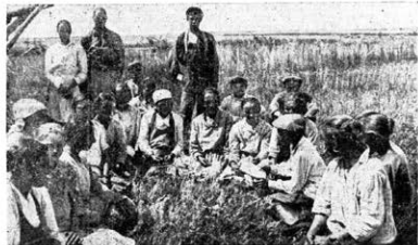
Die größte Empörung über den Faschistenachwiedel herrscht in der Deutschen Wolgarepublik. Unser Foto zeigt eine Versammlung einer Ernteliga mit dem Freize. Der Bajonet liegt aus der Erde & vor und schlägt vor, 16 Kinder aus Deutschland in eigenen Kolchos aufzunehmen.