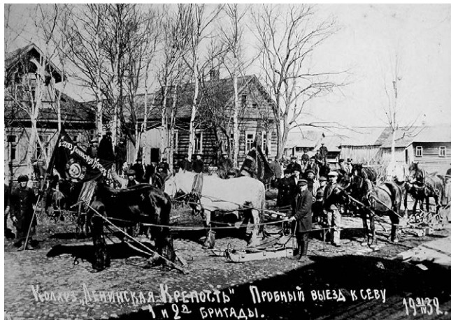
Колхоз «Ленинская крепость» в поселке Ручьи. Пробный выезд к севу. Первая и вторая бригады. 21 апреля 1932 г.