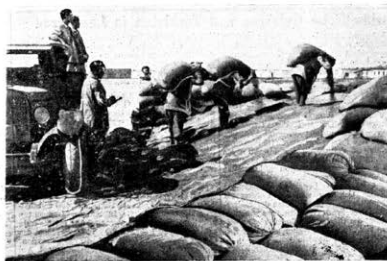
„Die deutschen Wolgabauern fressen vor lauter Hunger oft ihre eigenen Kinder“ liegt das Faschistenpack in die Welt hinaus. Während dieser Zeit häufen sich die Getreidestapel an den Schüttrampen, erfüllen die Kollektivisten 100% ihre Pflicht gegenüber dem sozialistischen Staat.