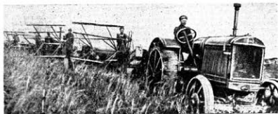
Während in Deutschland die armen und mittleren Bauern immer mehr verschuldet, sodass sie gezwungen sind, ihr letztes Vieh zu verkaufen, hat unser sozialistischer Staat hunderttausende Maschinen und Traktoren zur Verfügung gestellt, die die Arbeit erleichtern und das Vieh schützen.