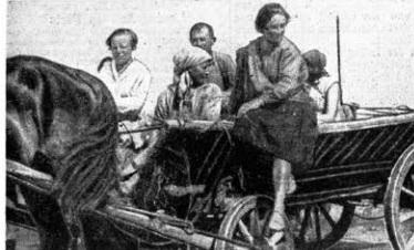
Eine Bauerngruppe vom deutschen Kolchos 1. Mai, die zur Heimatbild führt. Schon sie verhungert und zerrumpft aus! Diese Frauen können ruhig ihre Arbeit nachgehen, denn ihre Kinder bekommen sich wohlverahrt und gefüttert in Krippen und in der neu erbauten Schule.