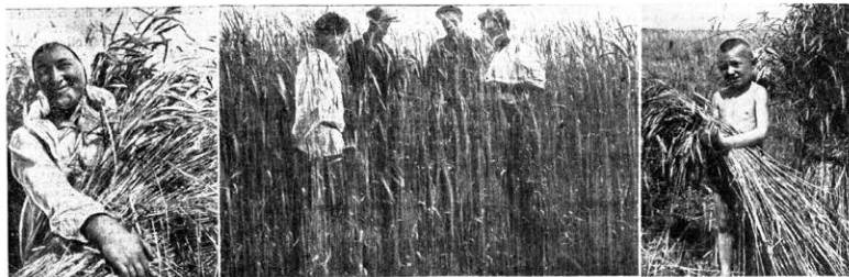
Das faschistische Regime in Deutschland hat den Arbeitern und Bauern die Erfüllung aller ihrer in der Sowjetunion erlangten. — Handerte von Protestbedien mit tausenden von Unterzehlten Wenschen versprochen. Das Ergebnis ist: Steigend' Not und Elend, jähre Enttäuschung. Um abzu waren die Antwort der deutschen Kollektivwirtschaftr auf diesen Verwundungstidzug. Unsere leichen haben die in christlichen Muehtatler die Lage von dem Hunger der deutschen Kündertischen fotos aus deutschen Kolchosen zeigen eine reiche Ernte, geluchtsen, gesunde und lustige Menschen.