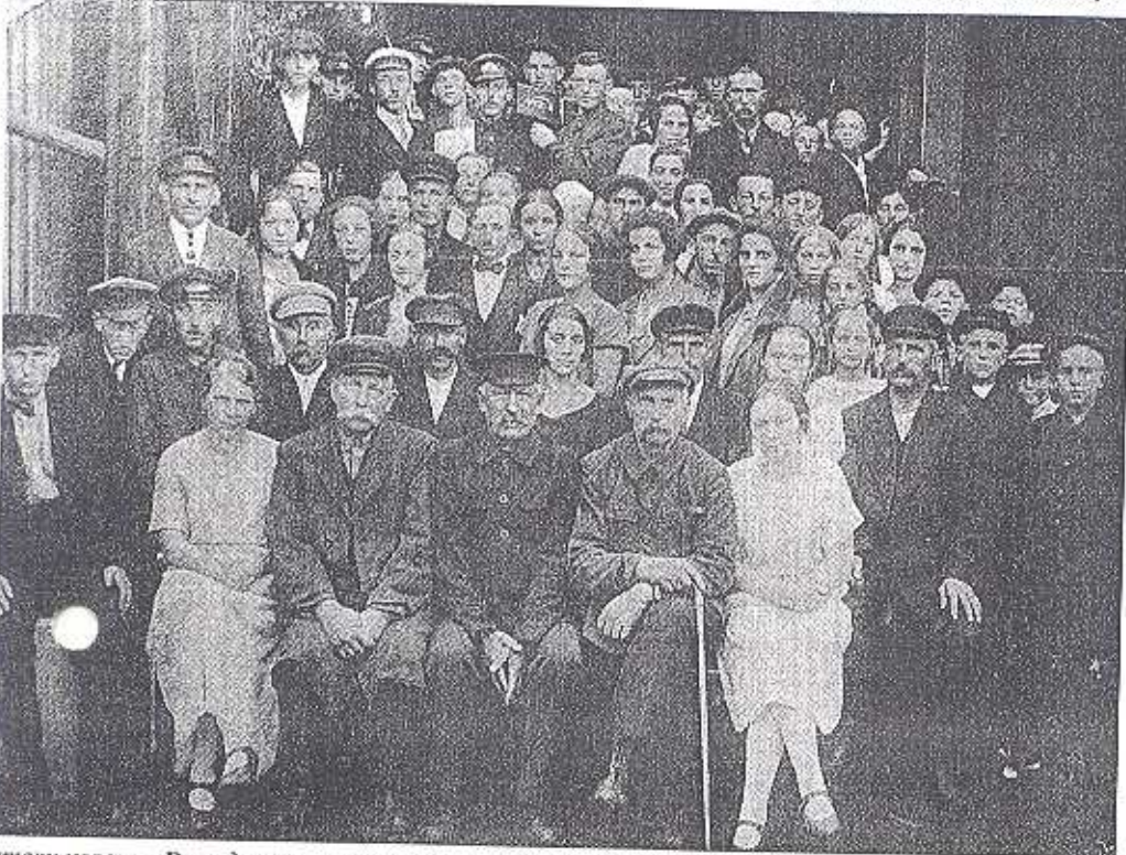
жители колонии Гражданки — групповое фото к столетию немецкой колонии.

И хотя от той, старой, Граж- :данки почти никаких следов не :осталось, она живет в памяти :старожил, в старинных фотогра- :фиях и воспоминаниях.